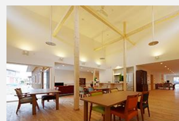
温かみのある木の空間

まだ雪が残る厚沢部ですが、おかげさまで20室満室になっています。外の気温は低いです、木のぬくもりを感じる空間は暖かそうです。過日、突然の要請に拘らずハウスの屋根の重積雪を近くの業者様がきれいに無償で取り除いていただきました。大変ありがたいことで、感謝しております。